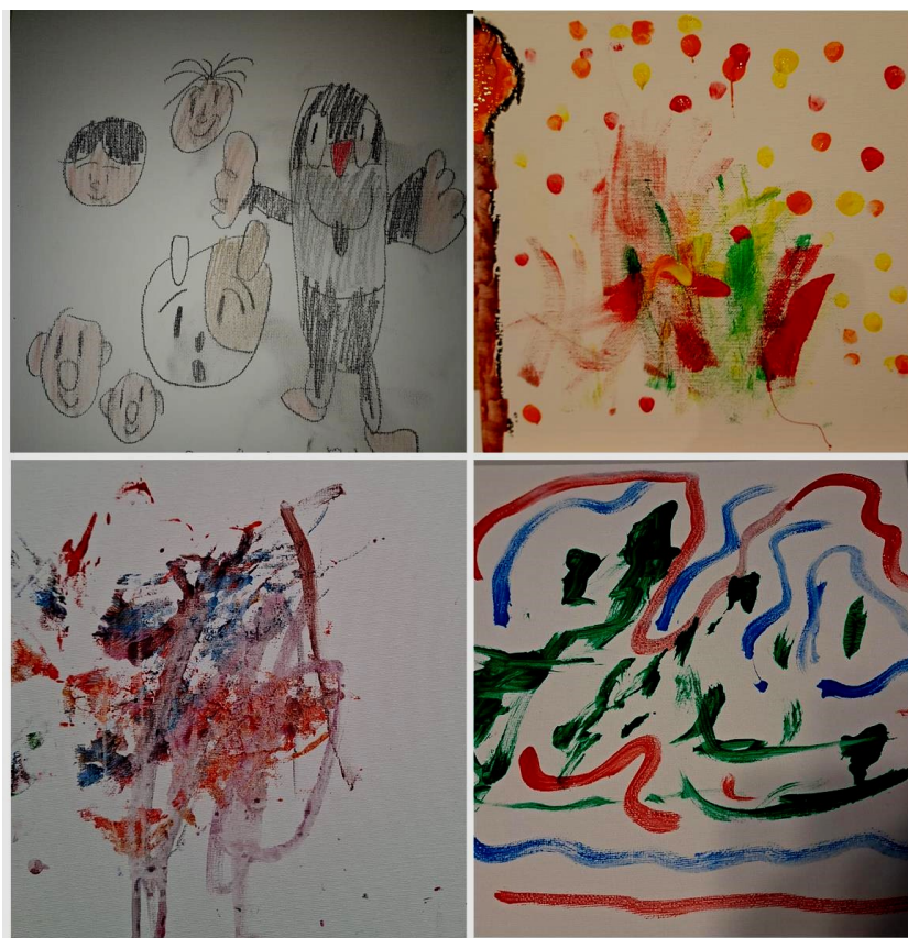
Powyżej rysunki naszych bohaterów